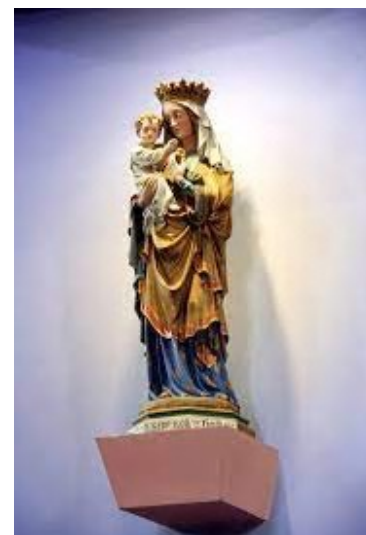
Afbeelding 1 - Onze Lieve Vrouw ter Nood, Heiloo