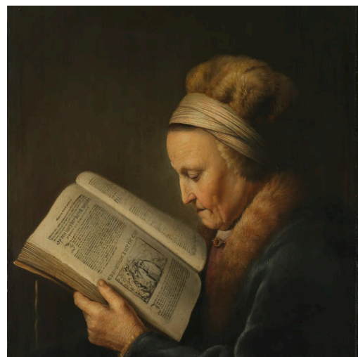
Afbeelding 19 - Lezende oude vrouw, Gerard Dou, ca. 1631