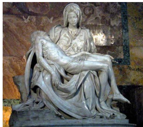
Afbeelding 16 - Piëta van Michelangelo, 1499, Sint-Pieter in Rome

In Nederland en ook in Europa had vanaf het begin van de jaartelling tot ongeveer de zestiende eeuw bijna alle kunst een christelijk thema. Deze piëta (pietà is Italiaans voor medelijden, liefdevolle eerbied) uit het einde van de vijftiende eeuw in de Sint-Pieter 19 in Rome is zonder twijfel een van de beroemdste beeldhouwwerken van de veelzijdige kunstenaar Michelangelo 20 . Je ziet dat het lichaam van Jezus zwaar en levenloos in de handen ligt van Maria, die als jonge moeder is uitgebeeld. Bedenk dat dit beeld gehakt is uit een blok marmer van 174 x 195 cm! In de beeldende kunst wordt het begrip piëta gebruikt voor de afbeelding van Maria met haar zojuist gestorven zoon. Stel je voor dat je een zoon verliest op zo'n gruwelijke manier. Terwijl het ook lijkt of Maria het lijden aanvaard heeft. Een schilderij van de Braziliaanse schilder Candido Portinari uit 1944 beeldt de dood van een kind uit, geïnspireerd op de piëta van Michelangelo. 21 Helaas is nog steeds niet voor alle mensen in de wereld een goed en volledig leven mogelijk. Mocht dat wel zo zijn, dan sterft toch ieder mens uiteindelijk: De dood hoort bij het leven. Het enige wat we kunnen doen is troost zoeken en het afscheid met mooie rituelen een plek geven.