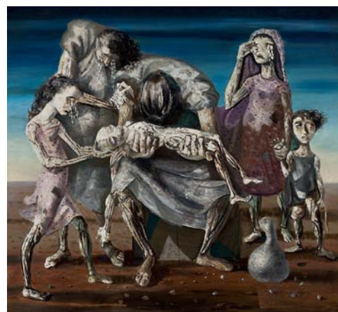
Afbeelding 17 - Dood kind, Candido Portinari, 1944