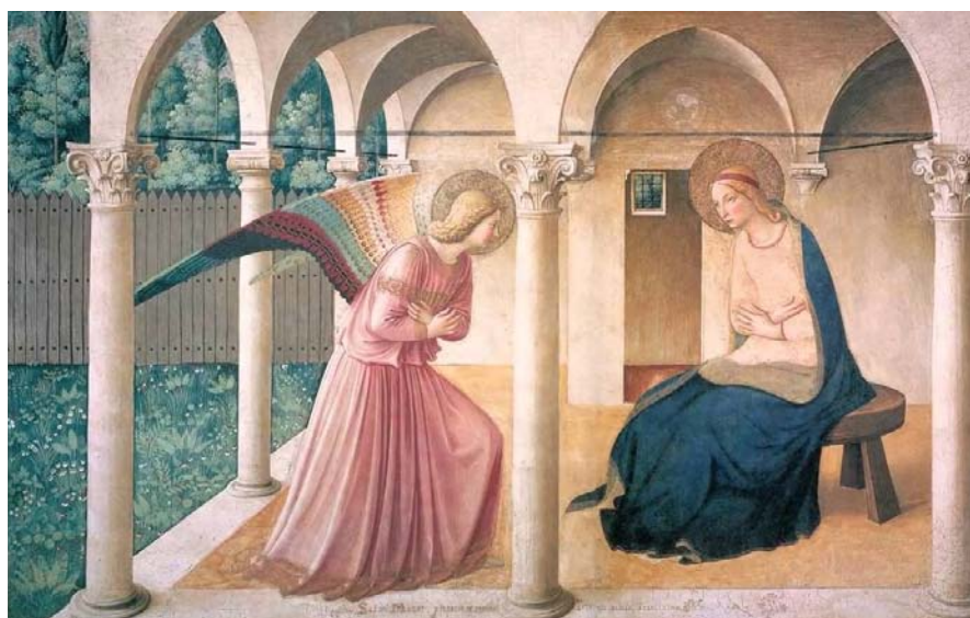
Afbeelding 5 - Fra Angelico, De Annunciatie, 1440-1445

Het eerste schilderij van Fra Angelico laat op een mooie verstilde manier Maria zien, die bezocht wordt door de engel Gabriël. Het is een fresco: verf die in natte kalk direct op de muur wordt geschilderd. Het stelt 'De annunciatie' voor, wat wil zeggen dat Maria de boodschap krijgt dat God haar heeft uitverkoren om de moeder van zijn Zoon te worden (Lucas 1:26-35). 9 Wat zal Maria gedacht hebben? Hoeveel twijfel zal ze gehad hebben?