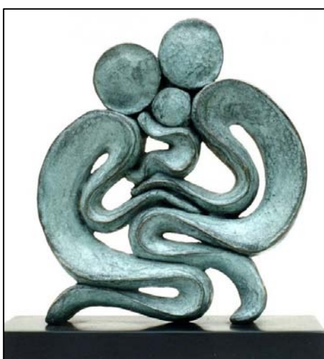
Afbeelding 8 - Full circle. In our hand we hold the future, Gill Brown, ca. 2010

Bedenk dat moeders niet alles kunnen en dat we allemaal anders zijn. Niet alleen moeders, maar beide ouders en/of verzorgers hebben ruimte nodig om liefdevol te zijn naar hun kinderen. Blijf dromen van het goede, blijf liefde en aandacht geven aan de mensen in je gezin en je omgeving, dan komt alles tot groei en bloei.