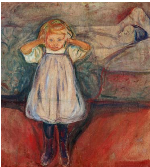
Afbeelding 12 - Dode moeder met kind, Eduard Munch, 1899

Wat het ook is, iedereen kent zijn eigen momenten van moeilijkheden en/of tegenslag.