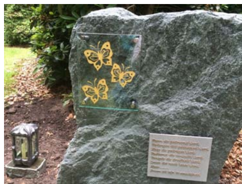
Afbeelding 13 - Monument onvervulde kinderwens - Berg en Bos in Apeldoorn

Wat het ook is, iedereen kent zijn eigen momenten van moeilijkheden en/of tegenslag.