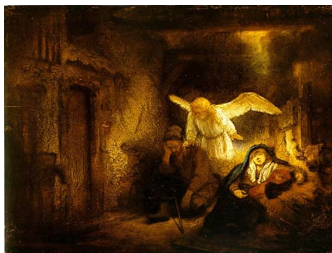
Afbeelding 6 - De engel verschijnt aan Jozef, Rembrandt van Rijn, ca. 1650

Een ander schilderij met ook een verschijning van een engel is gemaakt door Rembrandt van Rijn. Hierbij is Maria al bevallen van Jezus en zij liggen samen met Jozef te slapen. De engel verschijnt dan aan Jozef om hem te vertellen dat ze moeten vluchten naar Egypte (Matteus 2: 13-14). Een predikant schrijft heel mooi over de schilderijen van Rembrandt en dat bij dit schilderij God verschijnt als inspiratie in ons gewone leven. 10