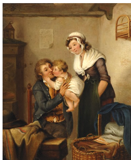
Afbeelding 7 - Vader, moeder en kind, Abraham Wilhelm Floh, ca. 1820

Dit rustpunt laat vooral de mooie tuin zien met de rozen, de jubileumboom (een Japanse sierkers) en oude beukenbomen (100 jaar oud!). Wat je ook tegenkomt op je levenspad, blijf geloven in liefde, groei én blijf dromen van wat er nog voor moois kan komen. Naast het moederschap is vooral goed ouderschap in al zijn vormen belangrijk om kinderen liefdevol op te kunnen voeden. Vreemd genoeg zijn er weinig kunstwerken die gaan over beide ouders die de liefde of de zorgzaamheid voor hun kind(eren) laten zien. Na lang zoeken vond ik een schilderij van de relatief onbekende kunstenaar Abraham Wilhelm Floh waarin de liefde van de vader voor het kind wordt uitgebeeld. Het hedendaagse gestileerde beeld van Gill Brown is een voorbeeld van ouders met kind. 11 Een stam in Zimbabwe, de Shona, maakt ook van dergelijke familiebeeldjes uit steen. 12