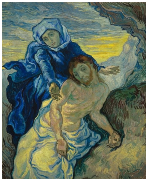
Afbeelding 18 - Piëta (naar Delacroix), Vincent van Gogh, 1889