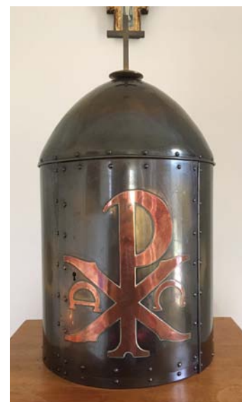
Afbeelding 4 – Tabernakel in de stiltekapel

De stiltekapel is overdag voor iedereen toegankelijk en het is een plek om tot rust te komen en de waan van de dag even achter je te laten. Je kunt een kaarsje aansteken en bidden. Midden vooraan in de stiltekapel staat een tabernakel met het Christusmonogram erop met tussen de X een Alpha en Omega. Dit Christusmonogram werd vanaf de vroegchristelijke periode (in de eerste eeuwen na Christus) gebruikt om de verrijzenis te duiden in de beeldende kunst. Het monogram is een combinatie van de letters Chi (X) en Rho (P): de Griekse letters voor het Latijnse Christus Rex, ofwel 'Koning Christus'. De letters Alpha en Omega – de eerste en laatste letter van het Griekse alfabet – verwijzen naar het begin en het einde. 8