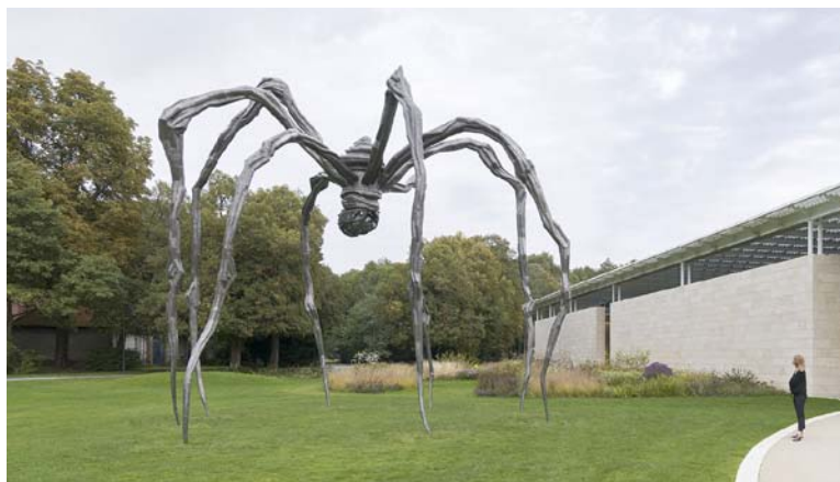
Afbeelding 15 - Maman, Louise Bourgeois, 1999 – Foto gemaakt bij een tijdelijke tentoonstelling van Museum Voorlinden in Wassenaar

Bij dit deel van het Meditatief Keienpad ligt een stapel keien en staat een boom met oude klimop erin. Misschien geeft het een ongemakkelijk gevoel, dat doet deze spin eveneens. Toch hoort dat ook bij ons leven, ongemak. Misschien is dit een plek om te beseffen welk ongemak je zelf voelt. Dit is een plek om hierbij stil te staan en je zorgen achter je te laten. Op de foto zie je de grootste spin die de kunstenares Louise Bourgeois ooit heeft gemaakt. 17 Veel van haar beelden verwijzen naar haar kindertijd. De beelden van spinnen zijn voor Bourgeois een hommage aan haar wevende, beschermende moeder. 18 Het kunstwerk roept diverse gevoelens op, van angst of juist een gevoel van bescherming. Louise Bourgeois speelt met onze gevoelens en verwerkt psychologische theorie in haar kunst. Spinnen kunnen een angstig gevoel oproepen, maar verwijzen ook naar de natuur. Spinnen in Nederland zijn niet gevaarlijk. Ze zijn juist heel nuttig, omdat ze veel insecten vangen. En ze zijn heel kundig, omdat ze een heel mooi web kunnen weven. Wat weet je van echte spinnen en hoe goed ken je de natuur met al zijn diversiteit eigenlijk?