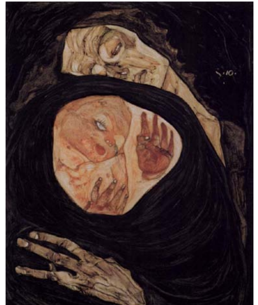
Afbeelding 10 - Egon Schiele, Dode Moeder I, 1910

Een ander schilderij laat een triest meisje zien met de handen op haar oren. Achter haar zie je haar moeder op haar sterfbed liggen. Vaak willen we dit niet weten of zien, maar toch gebeurt het: Niet alle ouders blijven leven tot hun kinderen volwassen zijn. Eduard Munch maakte dit mee op zijn vijfde jaar en schilderde later dit schilderij. Eduard Munch wordt ook wel de vader van het Expressionisme genoemd en schilderde dit schilderij rond 1899. 14 Het Expressionisme is de schilderstroming die het overbrengen van gevoel (expressie) in de kunst centraal stelde. Daarnaast kan het gebeuren dat je ongewenst kinderloos blijft. In natuurpark Berg & Bos in Apeldoorn is daar een klein monument voor geplaatst. 15 Mijn moeder werd wel oud, maar helaas kreeg ze last van dementie. De hedendaagse schilder Herman van Hoogdalem maakt indrukwekkende portretten van mensen met dementie. 16