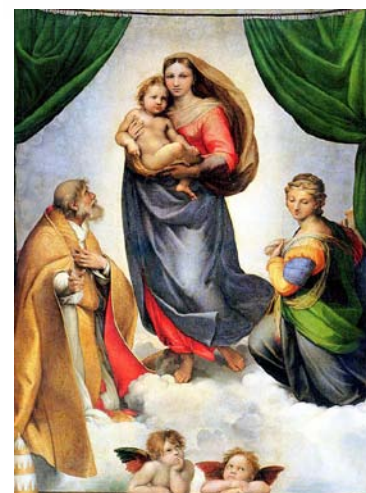
Afbeelding 2 - Sixtijnse Madonna, Rafaël, 1512