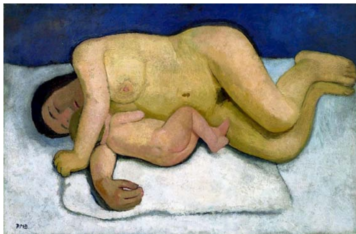
Afbeelding 3 - Liggende moeder met kind II, Paula Modersohn-Becker, 1906

Dit is een belangrijk schilderij in de kunstgeschiedenis. 4 Het is geschilderd door Paula Modersohn-Becker. 5 Zij was de eerste vrouwelijke kunstenaar die de traditionele, mannelijke kunstuitingen over vrouwen kritisch bekeek en vrouwen ging schilderen vanuit haar eigen vrouwelijke perspectief. 6 Zo maakte zij dit prachtige en verstilde schilderij van een liggende moeder met kind. Ze heeft het gestileerd, maar niet geïdealiseerd. Het is gebaseerd op de werkelijkheid.