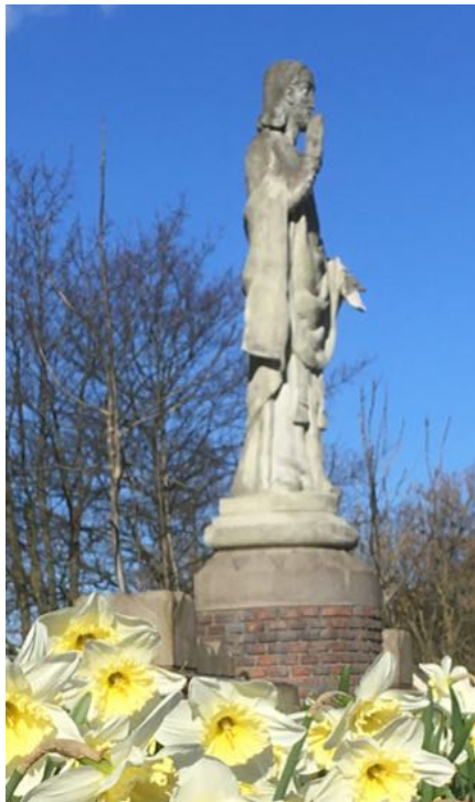
Afbeelding 20 - Heilig Hart beeld van Jezus, kerkplein voor de H. Joannes de Dooperkerk

Hier eindigt de wandeling. Dit Meditatief Keienpad is een landart kunstwerk (ontworpen in 2017 door mij) en hoort bij de H. Joannes de Dooperkerk in Pijnacker. Deze kunstwandeling is een ode aan mijn overleden moeder en schoonmoeder en aan alle moeders. Gelukkig zijn mijn moeder en schoonmoeder oud geworden, daarom nog een toegift: Een oude vrouw die uit de bijbel leest. 23 Verder wens ik dat iedereen leert omgaan met alles wat op zijn of haar pad komt.